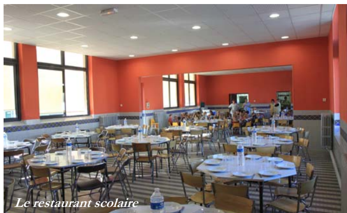
Le restaurant scolaire