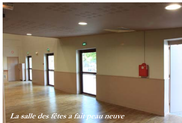
La salle des fêtes a fait peau neuve