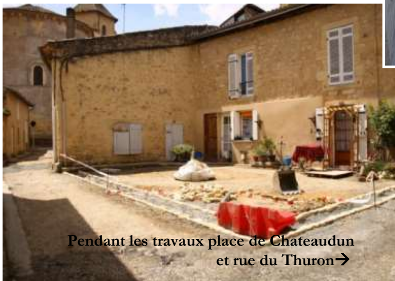
Pendant les travaux place de Chateaudun et rue du Thuron →