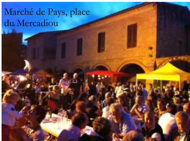
Marché de Pays, place du Mercadiou