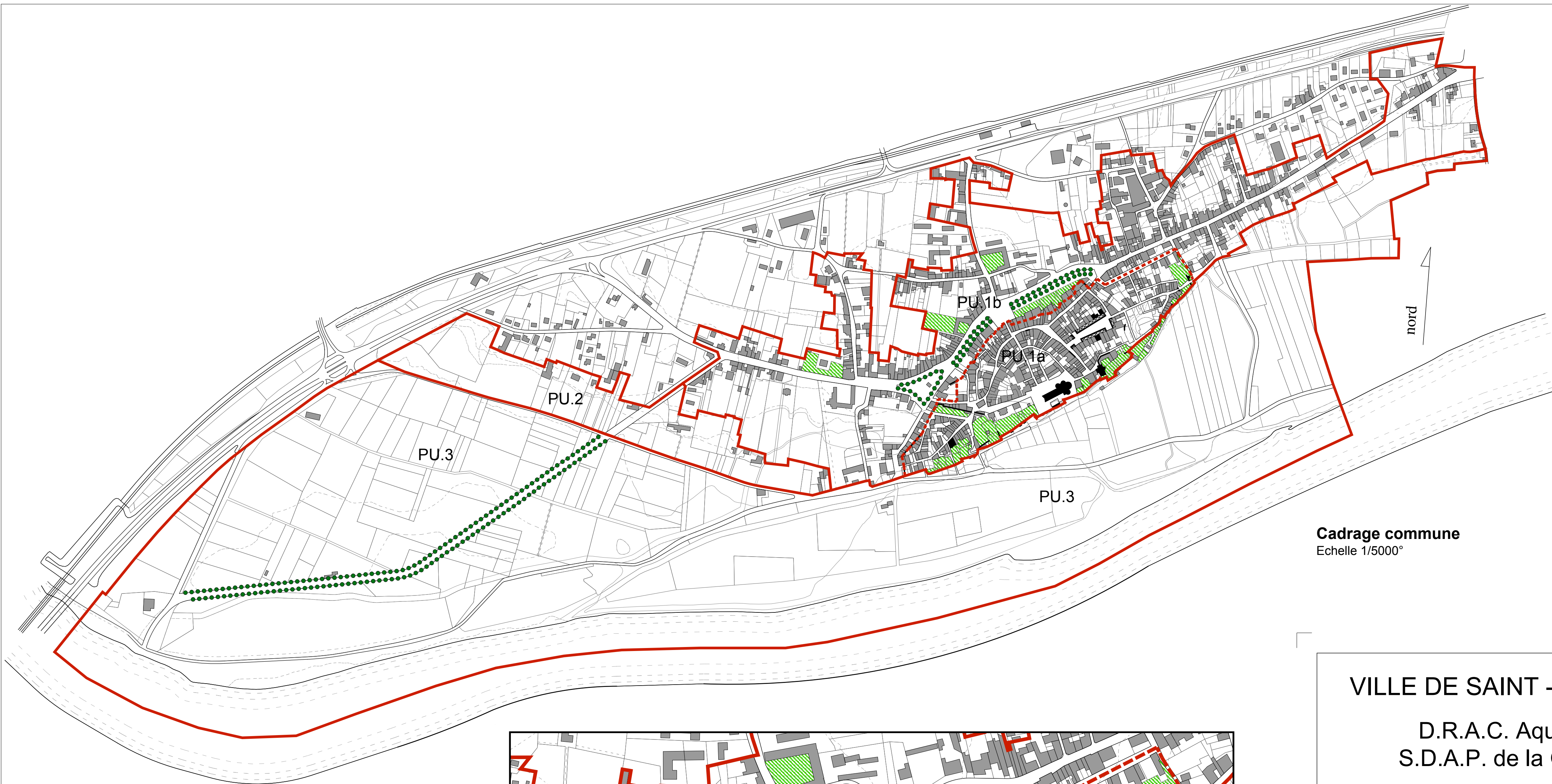
Cadrage commune Echelle 1/5000°