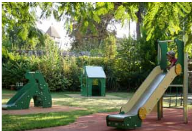
Aire de jeux rue des Ursulines (maison de retraite)

♦ Réfection de la toiture d'Ardilla (école de musique) :