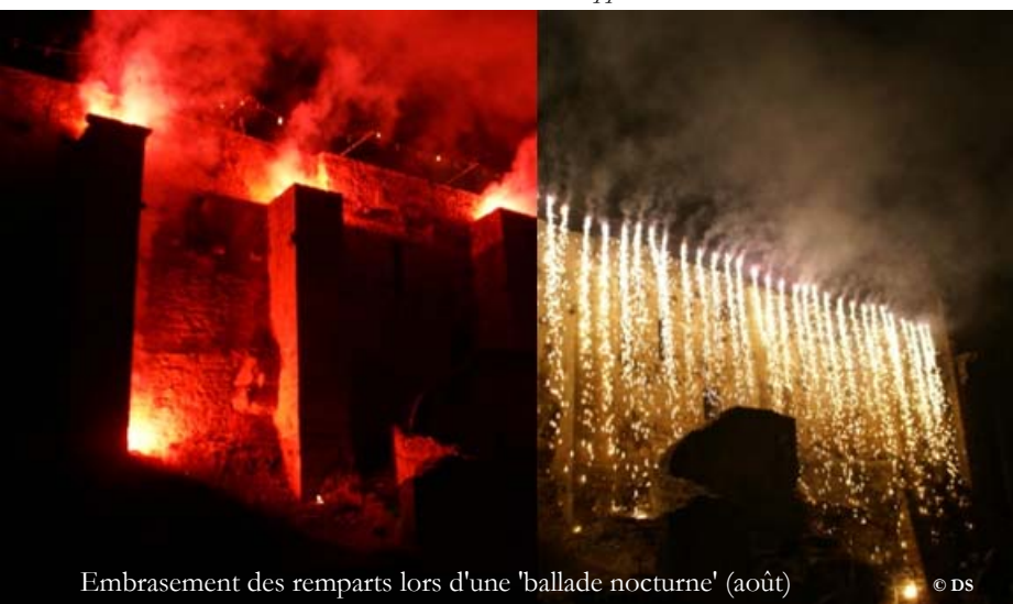
Embrasement des remparts lors d'une 'ballade nocturne' (août)