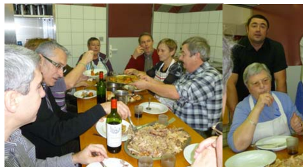
Les élus prennent des forces !