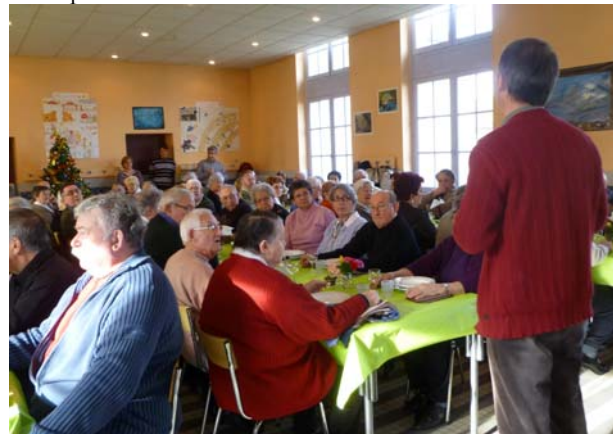
On écoute religieusement le discours de M. le Maire..