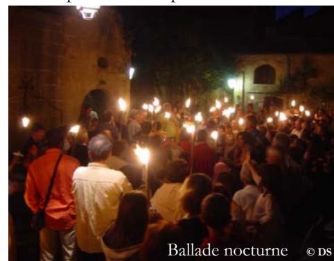
Ballade nocturne

- Ciné Site : projection du film "La tête en friche" : la date et le lieu seront précisés ultérieurement.